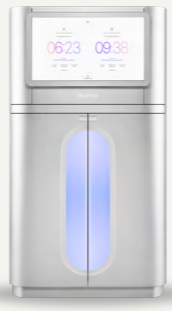
NovaSeq X Plus