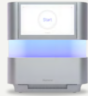
NextSeq 1000 & NextSeq 2000