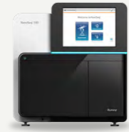
NextSeq 550 a