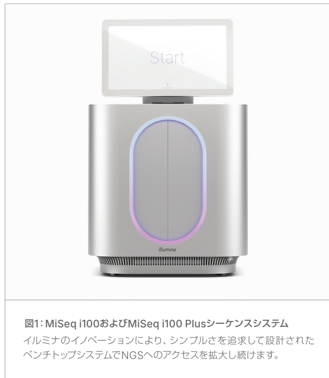
図1: MiSeq i100およびMiSeq i100 Plusシーケンスシステム

イルミナでは、お客様の体験をあらゆるイノベーションの中核に位置付けており、ライブラリー調製、シーケンス、データ解析を可能な限り簡単にすることを目指しています。MiSeq i100シリーズワークフローは、プロジェクトの完了に必要な時間と労力を最小に抑えるためにあらゆる点が最適化されています（表2）。MiSeq i100およびMiSeq i100 Plusシステムは、ランセットアップがわずか3つのステップで20分以内に完了するシンプルなワークフローを提供します。